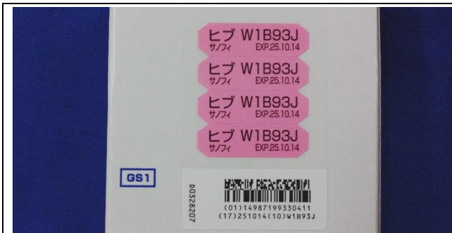
患者用ラベル (Jの表記有り)